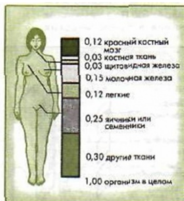
Рис. 5. Коэффициенты радиационного риска для разных органов человека при равномерном облучении всего тела