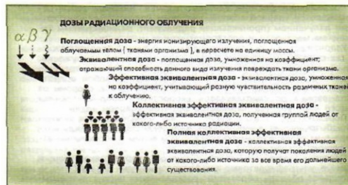
Рис. 4. Дозы радиационного облучения